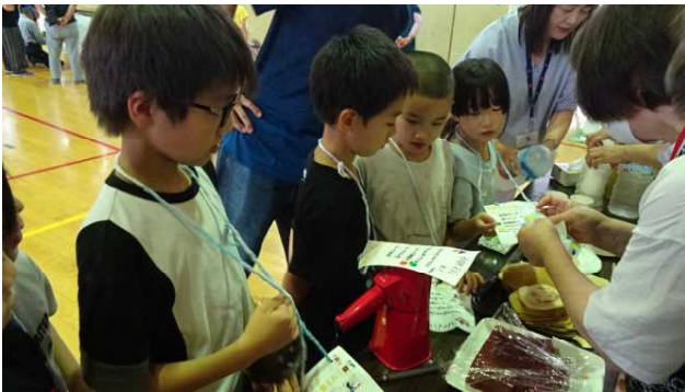
おいしいおやつコーナーです。地域の方が心を込めて作って下さいました。