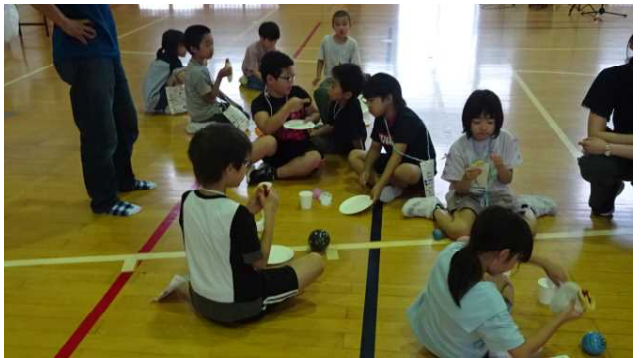
早速床に座って、各コーナーでの様子などを友達と語り合いながら、おやつを楽しく食べました。