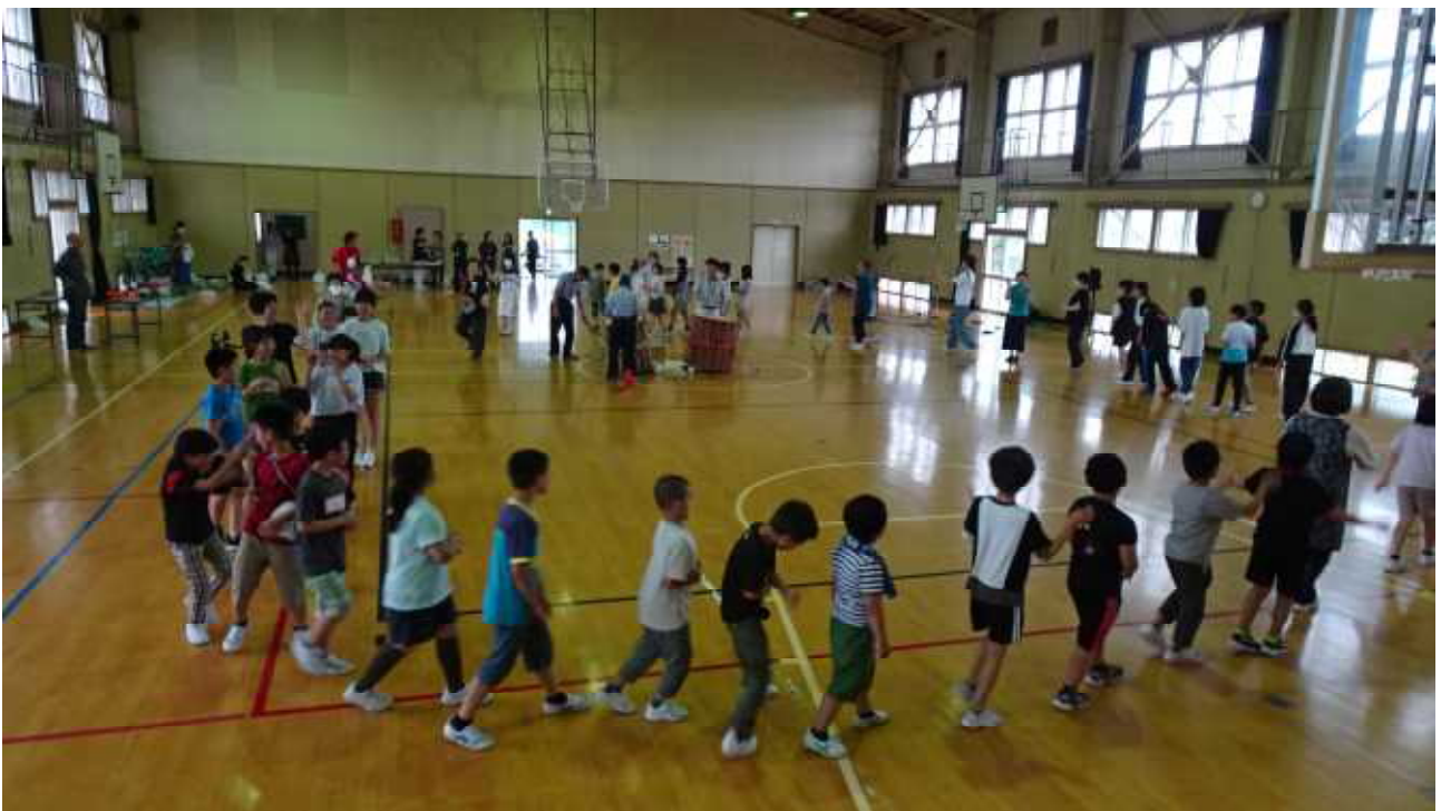
最後は盆踊りです。地域の方々の振り付けをまねしながらみんなで踊りました。

楽しいコーナーやイベントがたくさんあり、児童はお祭り気分を満喫できました。弘戸小学校最後の一年のよい思い出となりました。夏祭りを企画して下さった学校運営協議委員の皆様、協力して下さった地域の皆様、保護者の皆様、市教育委員会の皆様に心から感謝申し上げます。