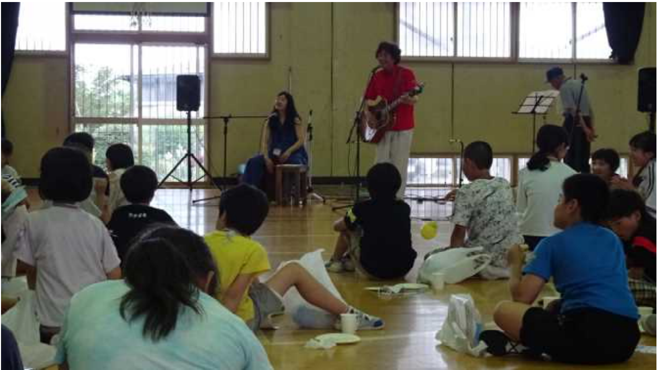
各コーナーを回り終わったあとは、「ダダダコわっしょいライブショー」です。市教育委員会の職員が仲間とともに、素敵な歌を聴かせていただきました。