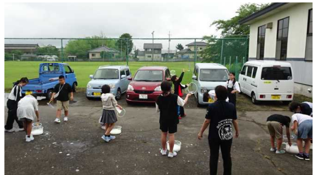
後半は高学年の児童も挑戦しました。大きいしゃぼん玉を作ろうと試行錯誤を重ねていました。