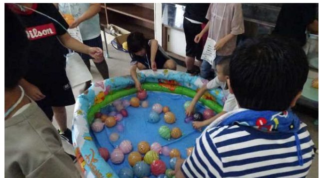
水風船コーナーです。自分の好きな色と大きさの風船を選んで、ヨーヨーのようにして遊びました。