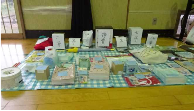
宝クジコーナーです。特賞を筆頭にたくさんの景品が用意されていました。何番のクジを引くのかは運次第です。