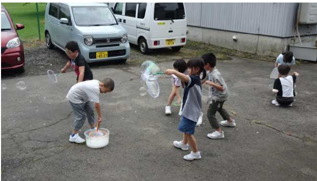
しゃぼん玉コーナーです。最初は低学年の児童が楽しみました。しゃぼん玉を作るために、素早く腕を振る人、風を利用する人…各自工夫していました。