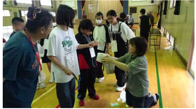
クジ引きに挑戦中。果たして何番を引いたのか？周りの友達も何番が出るのか興味津々。